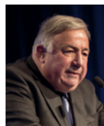
Gérard Larcher, président du Sénat « Oui, faisons confiance aux élus pour adapter les dispositifs nationaux aux besoins locaux.

spécificités et je comprends tout à fait que la République veuille organiser son territoire de la façon qui lui semble appropriée. C'est une question dont l'Europe n'a pas à connaître. [...] L'Europe doit rester l'Europe et la France doit rester la France. Je le dis notamment en relation avec les marchés publics et avec l'universalité du service public qui, oui, est une spécialité française mais qui est aussi un souci que doivent avoir à cœur de prendre en compte ceux qui négocient le Traité transatlantique avec les États-Unis. »