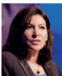
Anne Hidalgo, mairie de Paris « Nous devons être unis, comme nous le sommes, dans la candidature aux Jeux olympiques et paralympiques de Paris

[...] Le fonds exceptionnel d'un milliard d'euros pour l'investissement, créé cette année, sera non seulement reconduit l'année prochaine, mais porté à 1,2 milliard d'euros car c'est maintenant qu'il faut investir. »