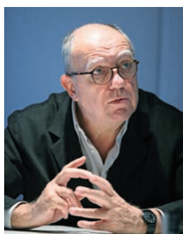
14. INTERVIEW Yves Lion, architecte et urbaniste