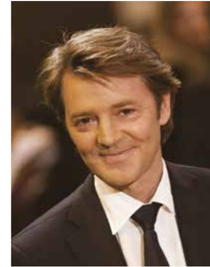
François BAROIN Président de l'AMF

Les communes et les intercommunalités sont engagées, comme le reste de la société, dans une profonde transformation numérique. En particulier, leurs échanges dématérialisés avec les citoyens, les acteurs économiques et les administrations publiques se sont multipliés. Dans le même temps, elles sont aussi devenues, ces derniers mois, des cibles d'attaques informatiques de plus en plus nombreuses.