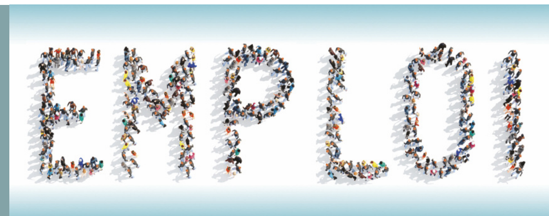
Couverture : © tai111/AdobeStock

En tant qu'acteurs de proximité, les collectivités disposent de leviers spécifiques et d'idées pour lutter, de façon pertinente, contre le chômage.