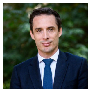
Jean-Baptiste Djebbari Ministre délégué chargé des transports

Tout ce qui permet d'encourager la mobilité des Français est une chance. Les véhicules en free-floating ne font pas exception. A nous de nous en emparer. A nous d'agir, ensemble, pour que le plus grand nombre puisse en bénéficier.