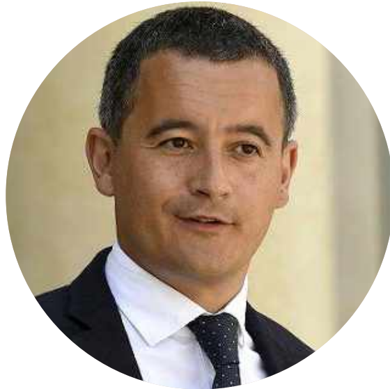
Gérald DARMANIN, Ministre de l'Intérieur